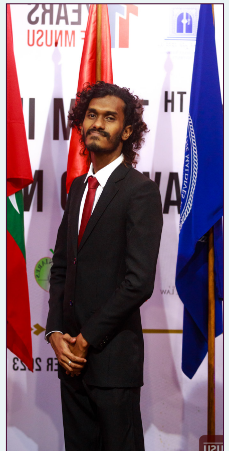
تعمیر و تعمیر