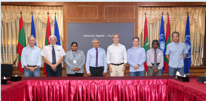
9th Quarter Report. The report covers the period from 1st January to 31st March 2021. The total revenue for the quarter is 1048200 (AED).