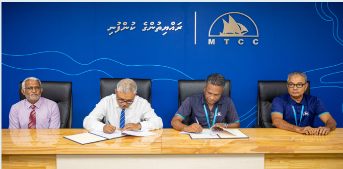
22nd Quarter Report. The report covers the period from 1st January to 31st March 2021. The total revenue for the quarter is 1048200 (AED).

23rd Quarter Report. The report covers the period from 1st January to 31st March 2021. The total revenue for the quarter is 1048200 (AED). The report also includes a detailed breakdown of the company's performance and financial position.