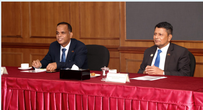
6 يونيو 2021 - تم توقيع اتفاقية تعاون بين جامعة قطر وجامعة القاهرة لتطوير برامج البكالوريوس في مجال التعليم الإلكتروني.