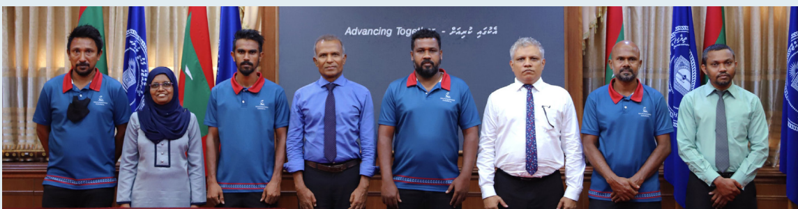
7 يونيو 2021 - تم توقيع اتفاقية تعاون بين جامعة قطر وجامعة القاهرة لتطوير برامج البكالوريوس في مجال التعليم الإلكتروني.