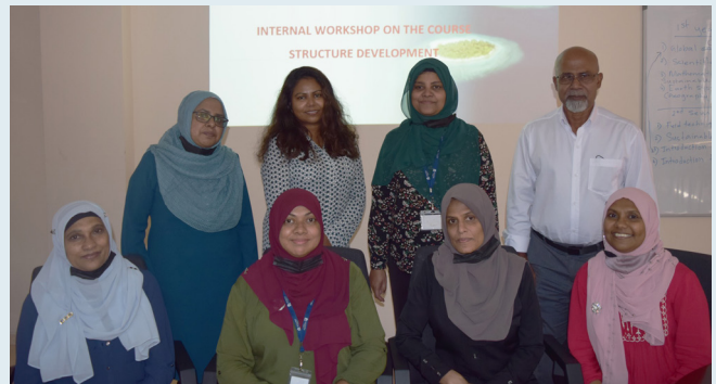
20 يونيو 2021 - تم توقيع اتفاقية تعاون بين جامعة قطر وجامعة القاهرة لتطوير برامج البكالوريوس في مجال التعليم الإلكتروني.