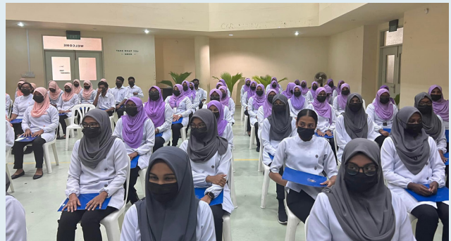
21st Quarter Report. The report covers the period from 1st January to 31st March 2021. The total revenue for the quarter is 1048200 (AED).