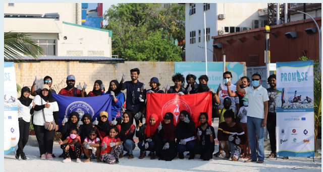
25th Quarter Report. The report covers the period from 1st January to 31st March 2021. The total revenue for the quarter is 1048200 (AED).